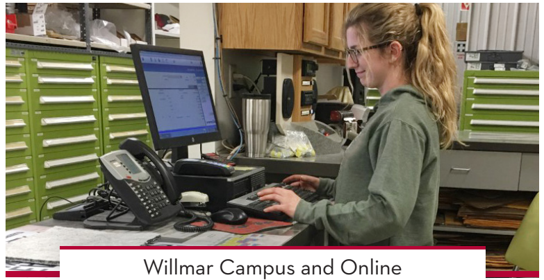
Willmar Campus and Online